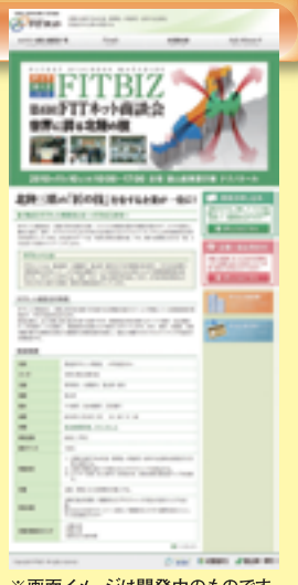
※画面イメージは開発中のものです。

Webサイトを活用し、充実の商談を実現してください! 商談会まではWebサイトで充実した商談会が実施できるようしっかりとリサーチを行ってください! Webサイトから気になる企業をチェックして、商談希望申請ができます! 企業名からはもちろん、製品・サービスの名称等のキーワードからターゲットとなる企業を検索して、参加企業の情報が細かくチェックでき、商談希望申請ができます。 お探しの商材・サービスなどが漠然としている時にもすべてのエントリー企業へ匿名で質問ができます! 「こんなサービスはないか?」「こんな課題があるがそれをソリューションしてくれないか?」等、漠然とした状態でも参加企業へ匿名で質問ができます。事前に商談先の絞り込みやミスマッチを防ぐ手段として活用できます。 参加企業へのサポート機能が充実します! 参加企業の詳細なプロフィール原稿を入稿したり、必要な提出書類をダウンロードすることができます。